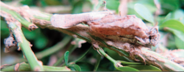
Kokon des Buchsbaumzünslers